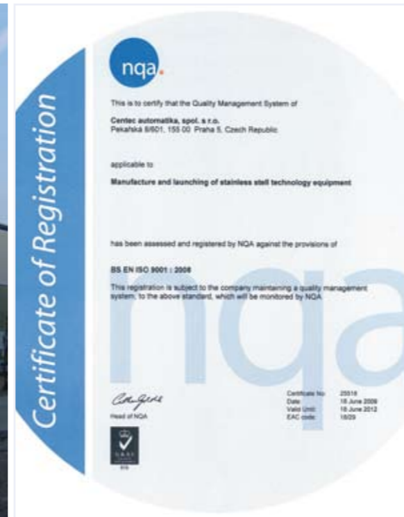
Die Centec Anlagenproduktion ist zertifiziert nach ISO 9001. The Centec Plant Production ist certified according ISO 9001.